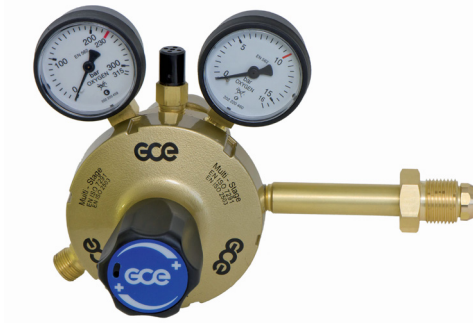
انواع رگلاتورهای سرکپسولی بین خطی و نقطه مصرف