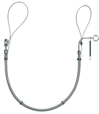
Flexible Hose جهت اتصال ایمن سیلندر به پنل