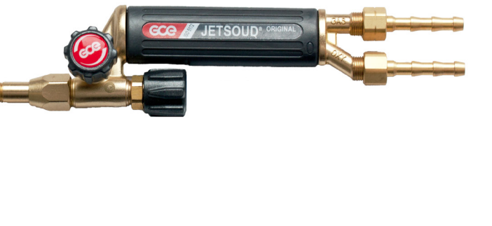
ابزار جوش و برش با ایمنی بالا