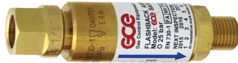
شعله خفه‌کن جهت جلوگیری از ورود حریق به داخل خط لوله